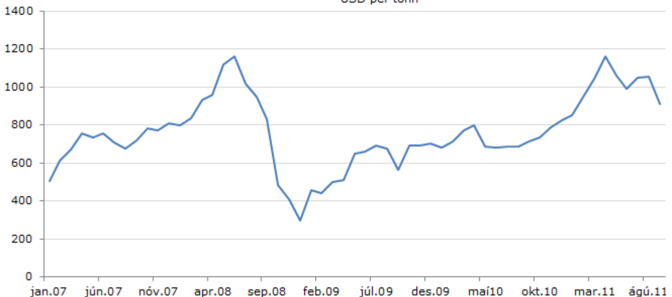
Innkaupaverð 95 oktana eldsneytis - USD per tonn

Til gamans má sjá að ef við gefum okkur að framundan sé á bilinu 5-10 kr. verðlækkun á bensíni þá myndi slíkt lækka vísitölu neysliverðs um u.þ.b. 0,12 til 0,24% milli mánaða.